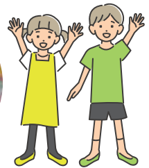
もり どうぶつ 森の動物たち

こころ よご じしやう 心の汚れた自称、 スペイン・サラゴサ万博 マスコットの おせん せい 汚染の精